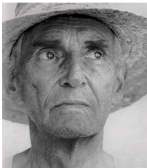
Armin T. Wegner auf Stromboli, 1964

„Die Armin T. Wegner-Gesellschaft will zur Erforschung, Pflege und Verbreitung des Werkes Armin T. Wegners beitragen. [...] Den Lebenskontexten des Dichters will die Armin T. Wegner-Gesellschaft in ihren Aktivitäten ebenfalls Rechnung tragen; [...] Neben Wegners Bedeutung als Schriftsteller soll gleichberechtigt sein gesellschaftlich-politisches Engagement gewürdigt und als ein Vorbild für Zivilcourage in lebendiger Erinnerung gehalten werden. So wie sich Wegner für Verfolgte – insbesondere für Armenier und Juden – und gegen den Krieg eingesetzt hat, so gehört der Einsatz für Menschenrechte, für Frieden, Toleranz und die Vermittlung zwischen den Kulturen und Religionen zum Programm der Armin T. Wegner-Gesellschaft.“